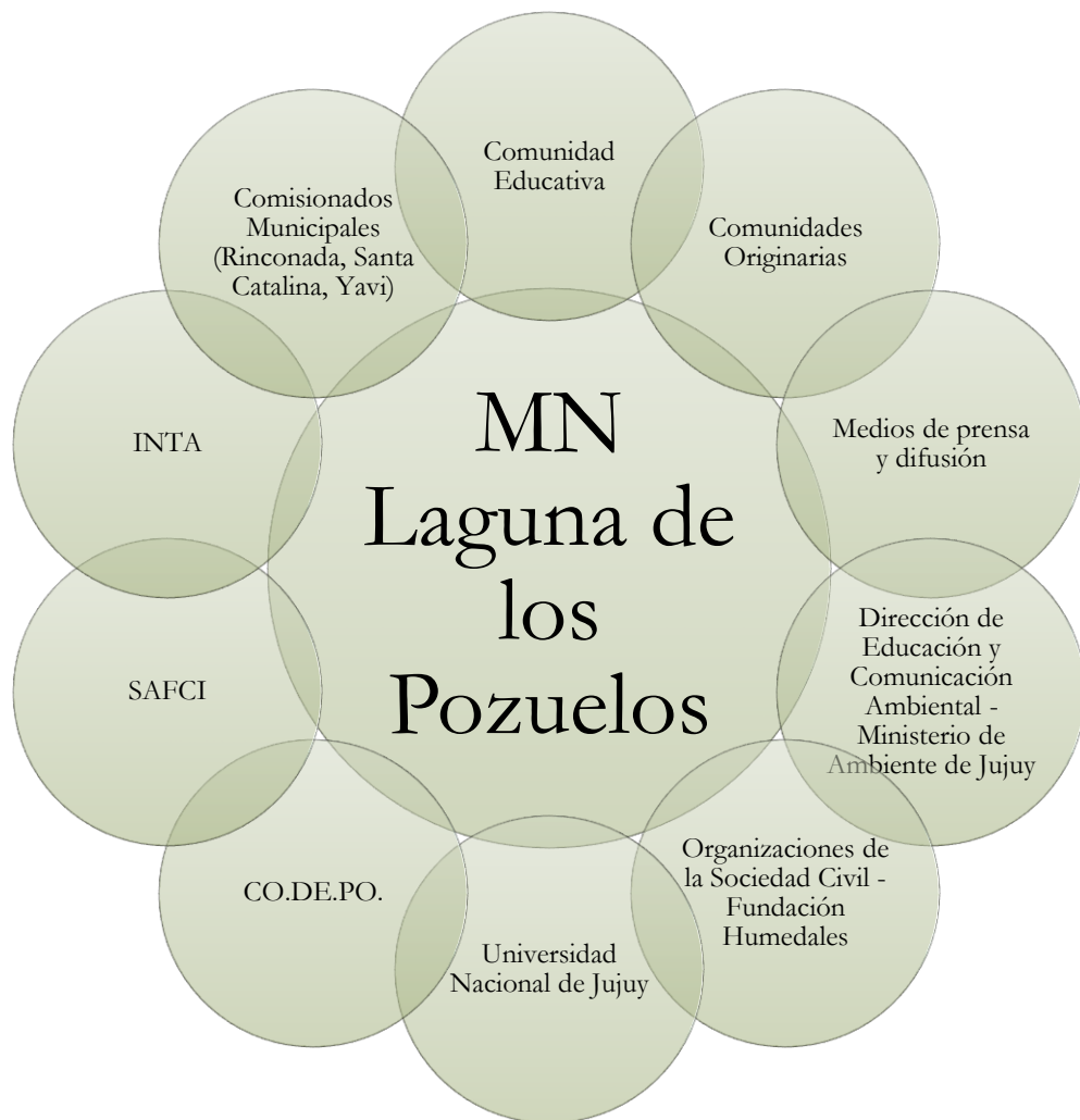
Figura N°2: Mapa de actores claves