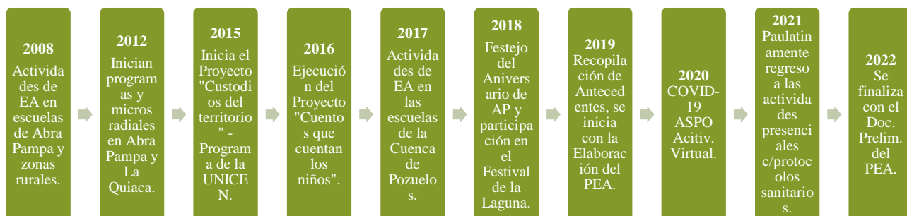
Figura N°1: Línea de tiempo - Antecedentes de Educación Ambiental del MNLP.