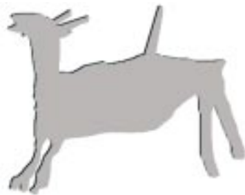
Grabado rupestre de huemul. Meseta del Ströbel, Santa Cruz.

Actualmente el huemul es objeto de varios estudios que permiten obtener información para optimizar su conservación. Dadas las dificultades para su observación directa, estos estudios suelen emplear evidencias de su presencia: sus rastros (huellas, bosteos, astas caídas, pelos o marcas en la vegetación).