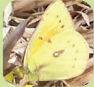
Colias lesbia - ♂