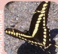
Heraclides thoas brasiliensis