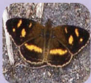
Telenassa berenice drusinilla