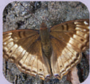
Doxocopa cyane burneisteri ♀