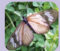
Actinote pellenae ♀