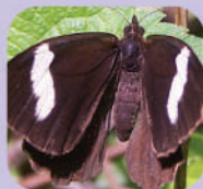
Pedaliodes palaeopolis lyssa