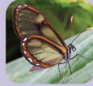
Pteronymia ozia tanampaya