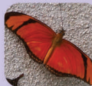
Dryas iulia alcionea