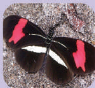
Heliconius erato phyllis