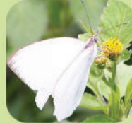
Ascia monuste automate