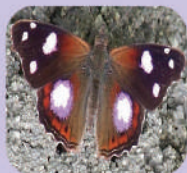
Cybdelis mnasylius petronita