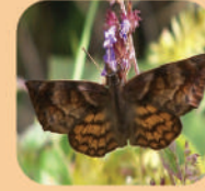
Timochares trifasciata sanda