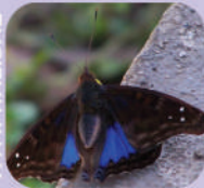
Doxocopa cyane burneisteri ♂