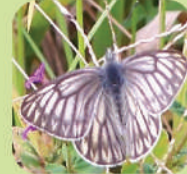
Tatochila stigmadice ♀