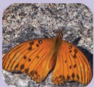
Agraulis vanillae maculosa