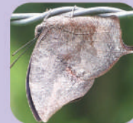
Memphis moruus morpheus