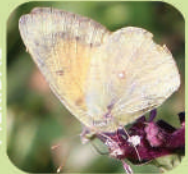
Colias lesbia - ♀