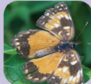
Chlosyne lacinia saundersi