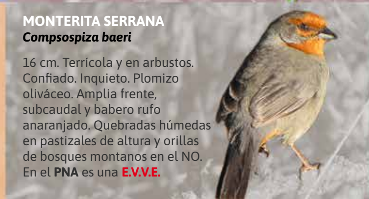
MONTERITA SERRANA Compsospiza baeri

15 cm. Tonos opacos. Cabeza, cuello dorsal y rabadilla grises. Espalda canela rosácea. Cubiertas negruzcas. Garganta blanca. Ventral gris que llega a blanco en abdomen. Estepas altoandinas.