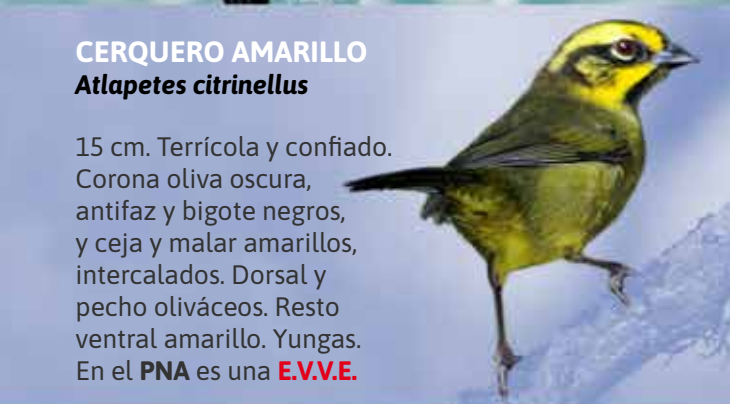
CERQUERO AMARILLO Atlapetes citrinellus

95 cm. Envergadura de 3 m. Utiliza las corrientes térmicas para sobrevolar buscando su alimento. Generalmente gregario. Se alimenta de carroña. Suele nidificar en paredones de difícil acceso. Pone de 1 a 2 huevos blancos o manchados. Esta especie es típica de las zonas más altas, cerca del límite del parque con la Provincia de Catamarca. Es muy probable observarlo en La Ciudadita, aunque es posible verlo en cercanías de los puestos La Cueva, Las Mesadas, La Cascada, Las Pavas y Pampa del Wirqui. En el PNA es una E.V.V.E.