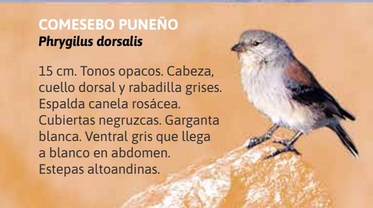
COMESEBO PUNEÑO Phrygilus dorsalis

35 cm. Amplia frente celeste. Corona amarillenta. Cara hombros y garganta amarillo oro. Bosques y sabanas de tipo chaqueño, yungas y poblados. En el PNA es una E.V.V.E.