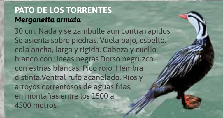
PATO DE LOS TORRENTES Merganetta armata

16 cm. Terrícola y en arbustos. Confiado. Inquieto. Plumizo oliváceo. Amplia frente, subcaudal y babero rufo anaranjado. Quebradas húmedas en pastizales de altura y orillas de bosques montanos en el NO. En el PNA es una E.V.V.E.