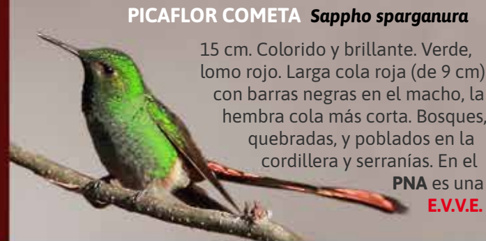
PICAFLOR COMETA Sappho sparganura

¡Esperamos que logre observar muchas de ellas!