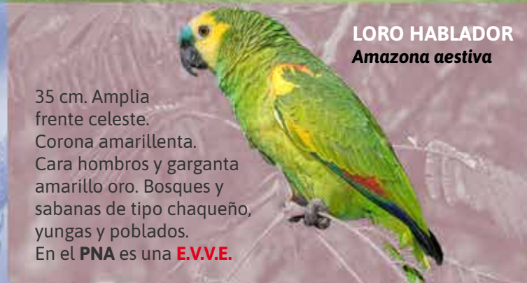
LORO HABLADOR Amazona aestiva

15 cm. Terrícola y confiado. Corona oliva oscura, antifaz y bigote negros, y ceja y malar amarillos, intercalados. Dorsal y pecho oliváceos. Resto ventral amarillo. Yungas. En el PNA es una E.V.V.E.