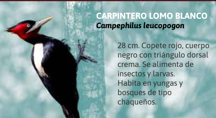
CARPINTERO LOMO BLANCO Campephilus leucopogon

15 cm. Colorido y brillante. Verde, lomo rojo. Larga cola roja (de 9 cm) con barras negras en el macho, la hembra cola más corta. Bosques, quebradas, y poblados en la cordillera y serranías. En el PNA es una E.V.V.E.