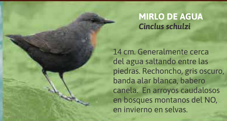
MIRLO DE AGUA Cinclus schulzi

28 cm. Copete rojo, cuerpo negro con triángulo dorsal crema. Se alimenta de insectos y larvas. Habita en yungas y bosques de tipo chaqueños.