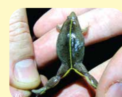
RANITA ACEITUNA Elachistocleis haroi Ø: 30 mm PNEI?, PNCó, RNF?