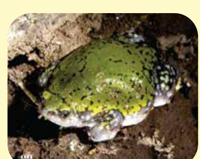
RANA MULLER CHAQUEÑA Dermatonotus muelleri Ø: 60 mm PNCó, PNEI?, RNF.