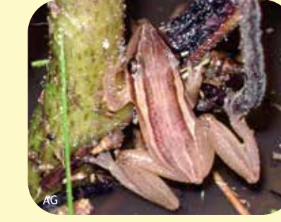
RANA HOCICUDA RAYADA Scinax squalirostris Ø: 27 mm PNCH