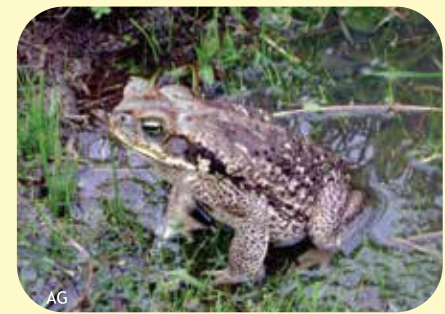
CURURÚ Rhinella schneideri Ø:230 mm PNCH, PNRRP, PNCó, RNF, RNECB