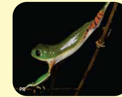
RANA MONO CHICA Pithecopus azureus Ø: 42 mm PNCH, PNRP, RNECB, RNF?