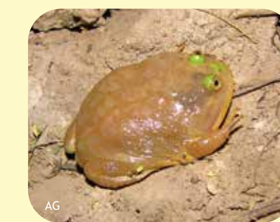
ESCUERZO Lepidobatrachus laevis Ø: 120 mm RNF