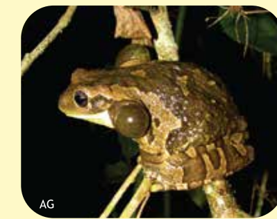
RANA TERNERO Trachycephalus typhonius Ø: 70 mm PNCH, PNRP, PNEI, PNCó, RNF?, RNECB?