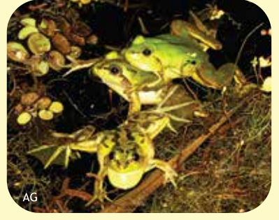
RANA NADADORA GRANDE Pseudis platensis Ø: 50 mm PNCH, PNRP, PNEI, PNCó, RNF, RNECB.