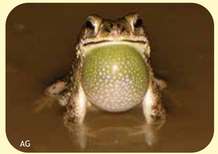
SAPITO CHAQUEÑO Rhinella major Ø:60 mm PNCH, PNRRP, PNEI, RNF, RNECB