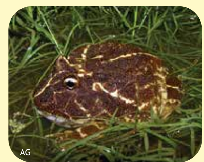
ESCUERZO CHAQUEÑO Ceratophrys cranwelli Ø:125 mm PNCH, PNCó, PNEI?