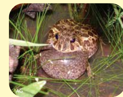
ESCUERCITO COMÚN Odontophrynus americanus Ø:70 mm PNCH, PNRP, PNCó?, RNECB