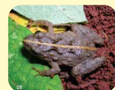
RANA ENANA Pseudopaludicola falcipes Ø:15 mm PNCH, PNRP, RNECB?