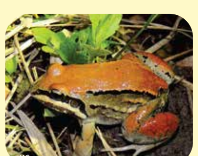
RANA DE BIGOTES Leptodactylus mystacinus Ø: 60 mm PNCH?, PNRP, RNEI, PNCó, RNF?, RNECB?