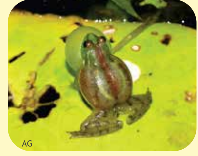
RANA NADADORA CHICA Lysapsus limellum Ø: 20 mm PNCH, PNRP, RNECB