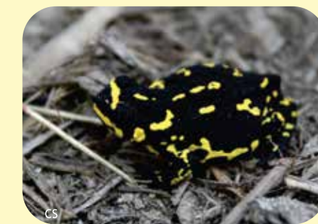
SAPITO NEGRO CHAQUEÑO Melanophryniscus klappenbachi Ø: 28 mm PNCH, PNRP, RNECB?