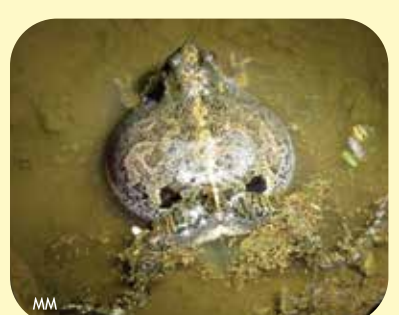
RANA LLORONA Physalaemus biligonigerus Ø: 40 mm PNCH, PNRP, PNEI, PNCó, RNF, RNECB.