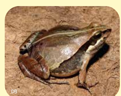
RANA MAULLADORA Physalaemus albonotatus Ø: 27 mm PNCH, PNRP, PNEI, PNCó, RNF, RNECB