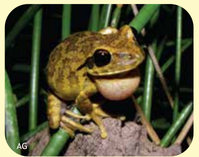
RANA TREPADORA CHAQUEÑA Boana raniceps Ø: 65 mm PNCH, PNRP, PNEI, PNCó, RNF, RNECB.