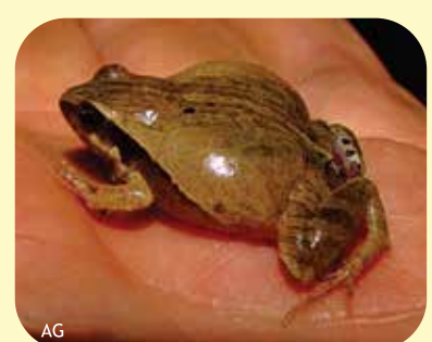
RANA MAULLADORA Physalaemus cuqui Ø: 27 mm PNCó, RNF?