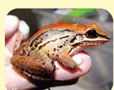
RANA Leptodactylus elenae Ø: 50 mm PNCH, PNRP, RNEI?, PNCó, RNF?, RNECB?