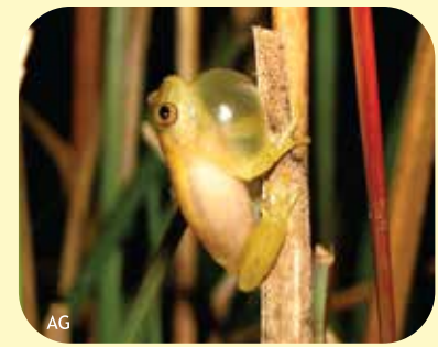
YUI-I CHAQUEÑA Dendropsophus nanus Ø: 24 mm PNCH, PNRP, PNEI, PNCó, RNF, RNECB