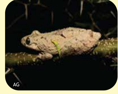
RANA HOCICUDA CHAQUEÑA Scinax acuminatus Ø: 45 mm PNCH, PNRP, PNEI, PNCó, RNF, RNECB.