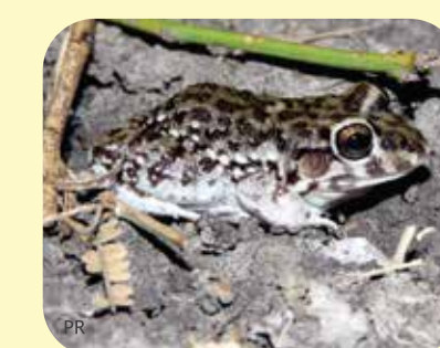
RANA SILVADORA Leptodactylus bufonius Ø: 65 mm PNCH, PNRP, PNEI, RNF, RNECB?