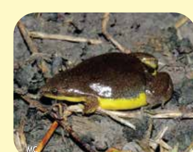
RANITA ACEITUNA Elachistocleis bicolor Ø: 45 mm PNCH, PNRP, PNEI?, PNCó, RNF, RNECB