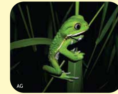
RANA MONO Phyllomedusa sauvagii Ø: 70 mm PNRP, PNCó, RNF