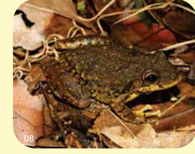
RANA TREPADORA HOCICUDA Scinax fuscovarius Ø:55 mm PNCH, PNRP, PNEI, PNCó, RNF, RNECB.