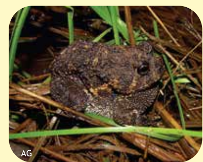
ESCUERCITO SANTIAGUENSE Odontophrynus lavillai Ø: 65 mm PNEI, PNCó, RNF