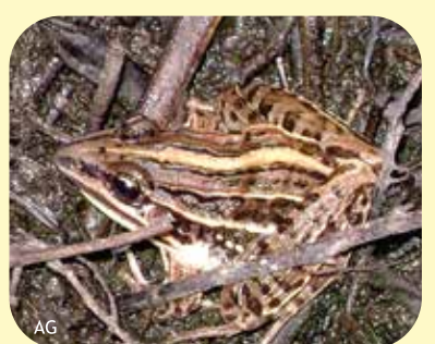
RANA RAYADA Leptodactylus gracilis Ø: 55 mm PNCH, PNRP, RNECB?