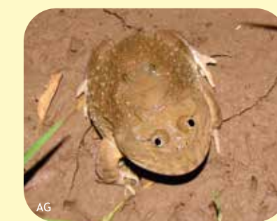
ESCUERZO Lepidobatrachus llanensis Ø: 100 mm RNF?