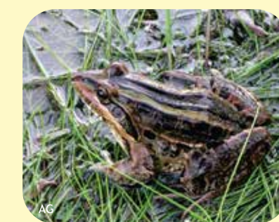
RANA CRIOLLA Leptodactylus latrans Ø:150 mm PNCH, PNRP, RNECB, RNF?