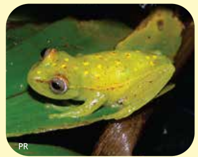
RANA PUNTEADA Boana punctata Ø: 35 mm RNECB