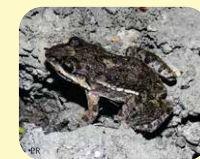
RANA PIADORA Leptodactylus latinasus Ø:42 mm PNCH, PNRP, PNEI, RNF, RNECB?