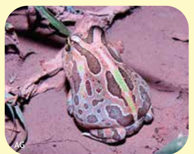
ESCUERCITO PEQUEÑO Chacophrys pierottii Ø: 55 mm PNEI?, PNCó?, RNF