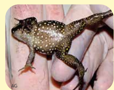
RANITA VIENTRE PUNTEADO Leptodactylus podicipinus Ø: 40 mm PNCH, PNRP, RNECB?