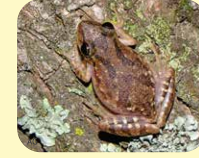
RANA TREPADORA HOCICUDA Scinax nasicus Ø: 35 mm PNCH, PNRP, PNEI, PNCó, RNF, RNECB.