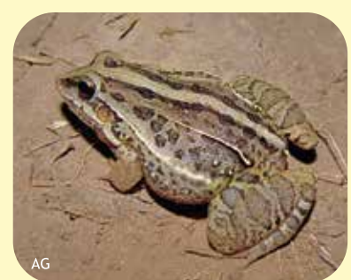
RANA Leptodactylus fuscus Ø:55 mm PNCH, PNRP, PNEI, PNCó, RNF?, RNECB?