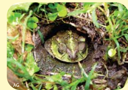
SAPITO CAVADOR Rhinella fernandae Ø:70 mm PNCH