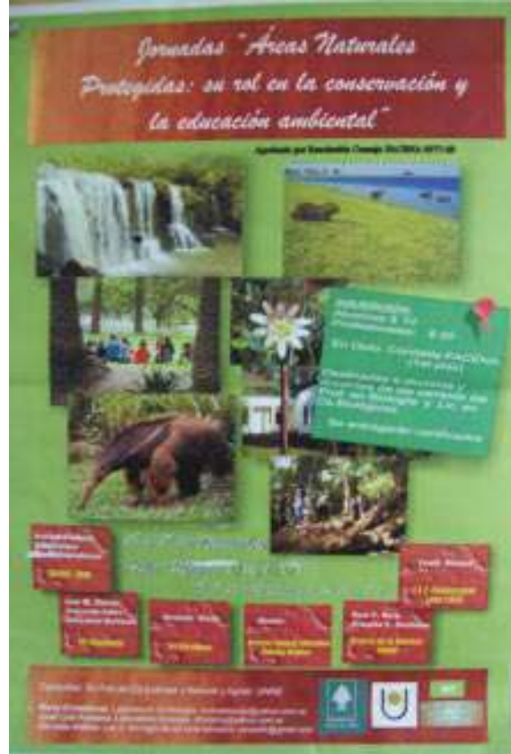
Lámina del proyecto.