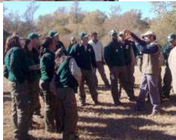
Trabajo en campo.

Asistieron al encuentro 26 agentes de conservación de: Bolivia, Chile, Colombia, Costa Rica, Cuba, México, Nicaragua, Panamá, Perú y dependencias municipales y provinciales de Argentina. Además, 18 personas con funciones actuales y específicas en educación, interpretación y difusión del patrimonio natural y cultural de Parques Nacionales de la Delegación Centro, Delegación Noroeste, PN Iguazú, PN Lanín, PN Quebrada del Condorito, PN El Leoncito, PN Talampaya, PN Campo de los Alisos y Casa Central.