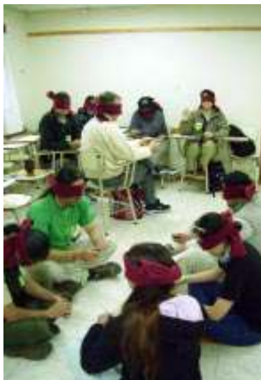
Experiencias sobre no videntes.