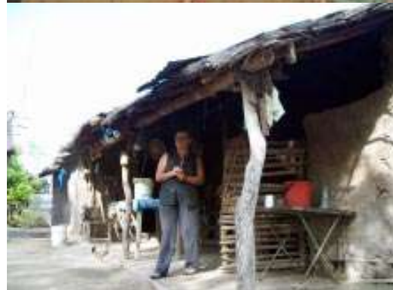
Trabajo con pobladores.