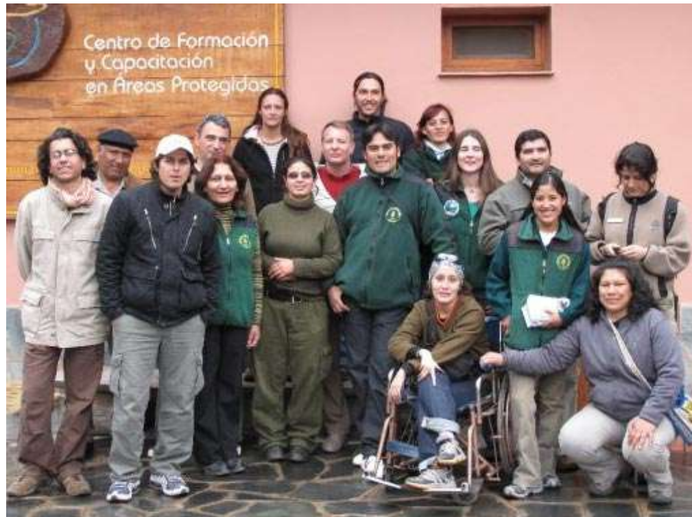
Participantes del taller.

En nuestros Parques Nacionales encontramos barreras físicas y comunicacionales que no permiten el pleno acceso, circulación, comunicación y disfrute.