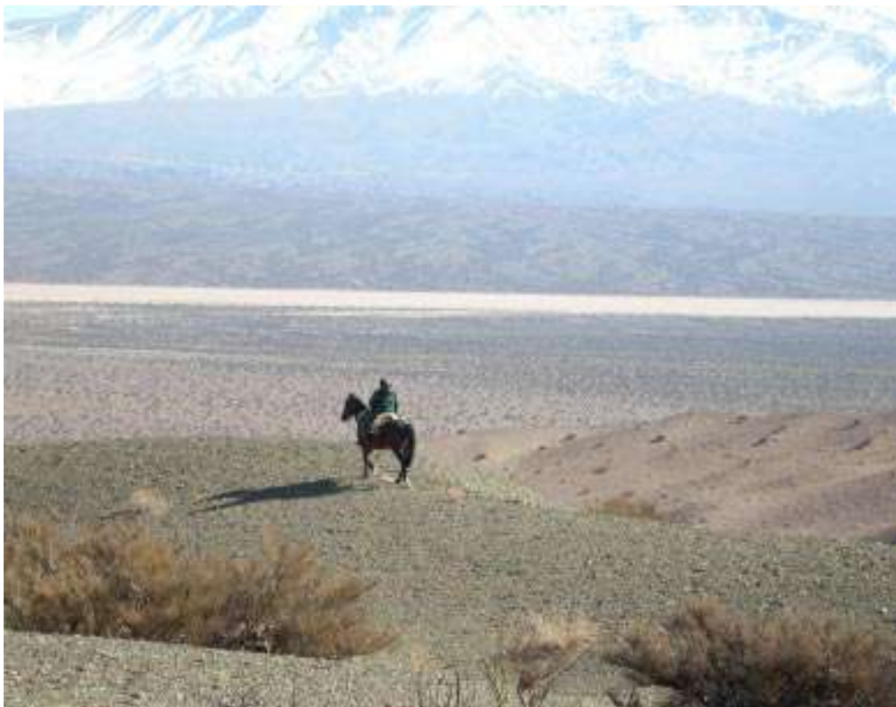
PN El Leoncito

solamente desde la interpretación ambiental. Ante la necesidad de ampliar las estrategias que abarca el trabajo educativo en las áreas protegidas actuales, se organizó la educación en cuatro estrategias, a fin de facilitar la planificación y análisis de la práctica: estrategia de interpretación, de extensión, de educación formal y de capacitación. El criterio de organización de estas estrategias es práctico y está vinculado a los procedimientos que utilizamos para desarrollar los proyectos en cada una de ellas.