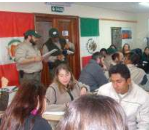
Taller. Mesas de trabajo.