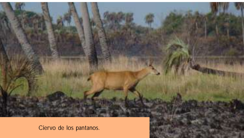
Ciervo de los pantanos.

Esto es tan solo el comienzo, y esperamos para la segunda mitad del año 2010 tener los primeros resultados del diagnóstico y a partir de este poder diseñar como seguir en la próxima etapa.