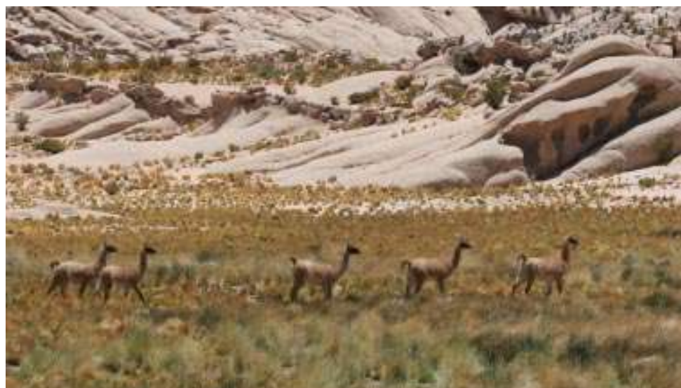
PN San Guillermo

Preocupa ver que las actividades educativas se realizan en muchos casos como un fin en sí mismas y no como una de las estrategias, junto con la